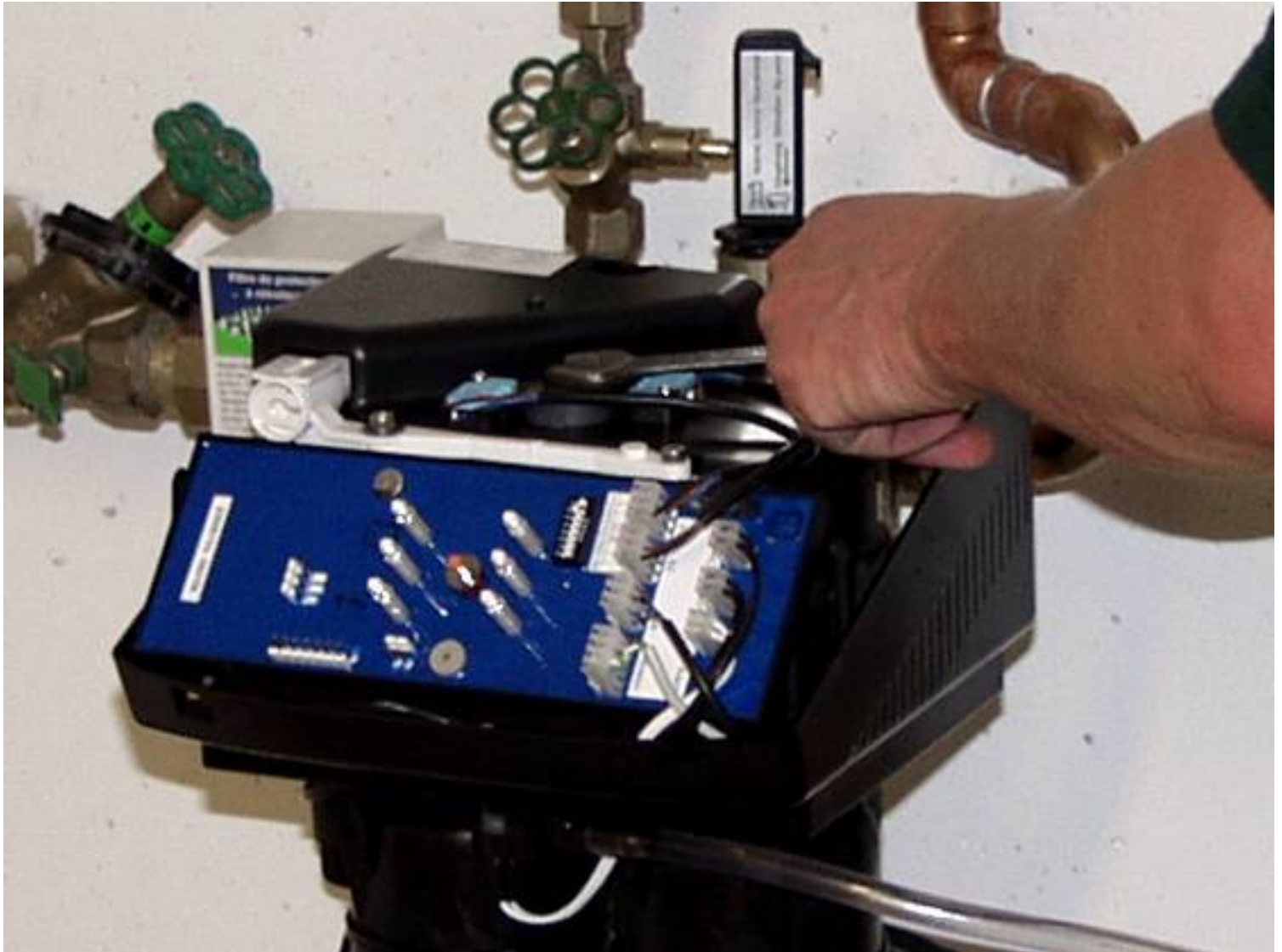
Entlüftung der Anlage

Mit einem Gabelschlüssel SW 13 wird die Achse des Treibrades im Uhrzeigersinn gedreht. Im Bereich der Spülstellungen (Wasser läuft über den Abwasserschlauch ab) jeweils ca. 30 Sek. anhalten. Nach einer vollen Umdrehung ist das Entlüften beendet.